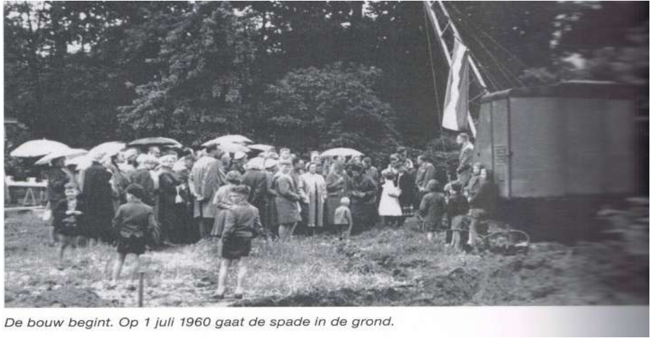
De bouw begint. Op 1 juli 1960 gaat de spade in de grond.

> De onderlinge betrokkenheid was als vanouds groot, mede dankzij een goed lopende organisatie van contactleden <