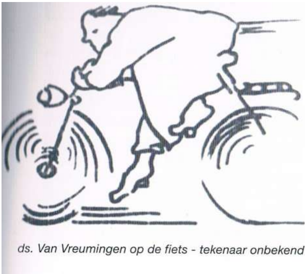
ds. Van Vreumingen op de fiets - tekenaar onbekend