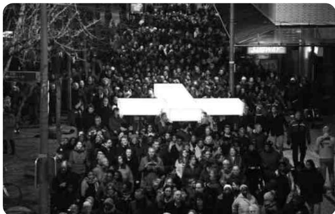
The Passion in de Bijlmer 2018

In deze inleiding nodig ik u uit voor een zoektocht naar filosofische contouren van het heilige. Dit is een risicovolle onderneming, want de kern van het heilige is niet in woorden te vatten. Kunnen wij dan niet beter zwijgen over dit fenomeen? Gesterkt door een uitspraak van literair criticus Van Groenewegen die zei dat 'de ziel die zich verscheurt in vergeefse verwoording daarbij het geluk smaakt te beseffen wat hij verlangt' denk ik dat reflectie, schrijven en gesprek waardevolle inzichten verschaffen kan over het verlangen naar het heilige. Het kan duidelijk maken wat het inhoudt en wat heilig leven zou kunnen betekenen. In deze bijdrage doe ik een poging om het heilige te omschrijven en kenmerken van heilig leven te ontwaren.