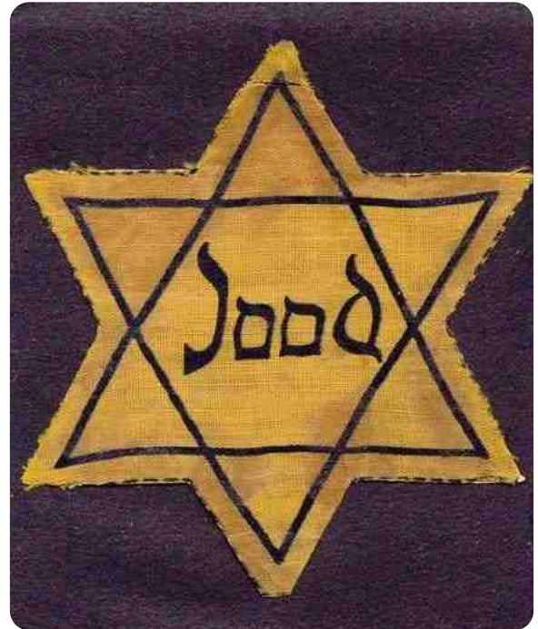
Jodenster met quasi Hebreeuwse letters in het hart van de Davidster

Een rond lapje gele stof op hun jas. De betekenis is die van een munt, maar ook die van de hostie. De kleur weten we al.