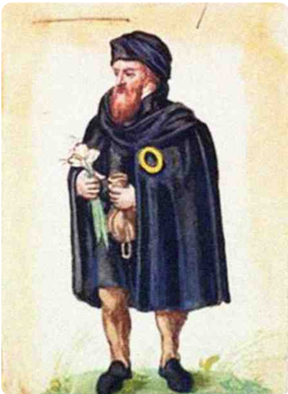
De Jodenring (bovenzijde jas)

Hij wilde huwelijken tussen Joden en christenen op die manier verhinderen. En was daarmee een 'voorloper' van de Oostenrijker Adolf Hitler. Vanwege de woekerrente worden Joden verplicht de Jodenring te dragen.