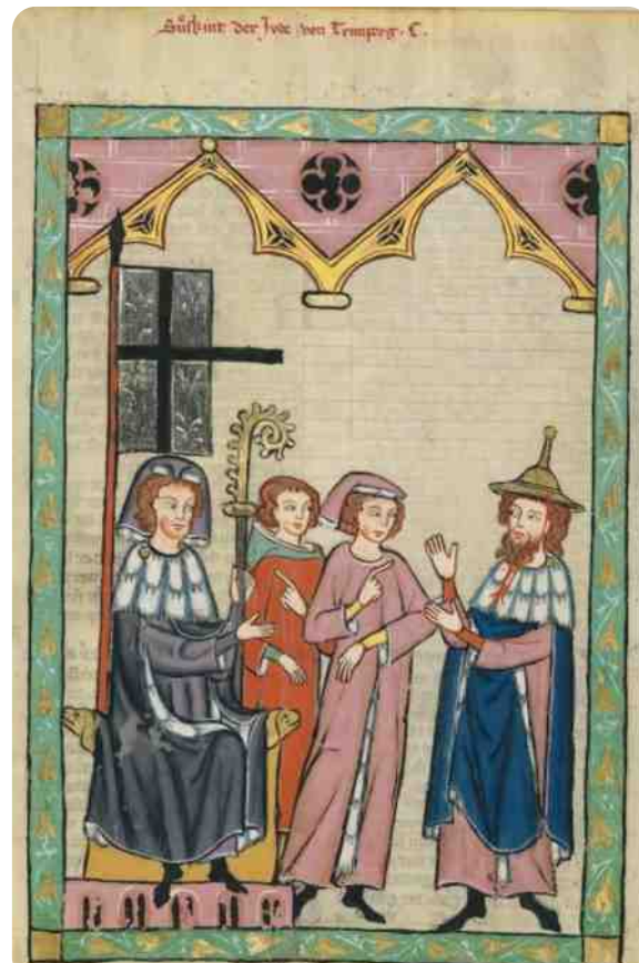
Joodse troubadour met Jodenhoed

Al deze 'misdaden' riepen om wraak. De Joden werden verplicht een speciale hoed te dragen, meestal geel of rood van kleur. De kleur geel symboliseerde de afkeuring, de haat. Rood stond voor hel en duivel. Hiernaast twee voorbeelden van de Jodenhoe-