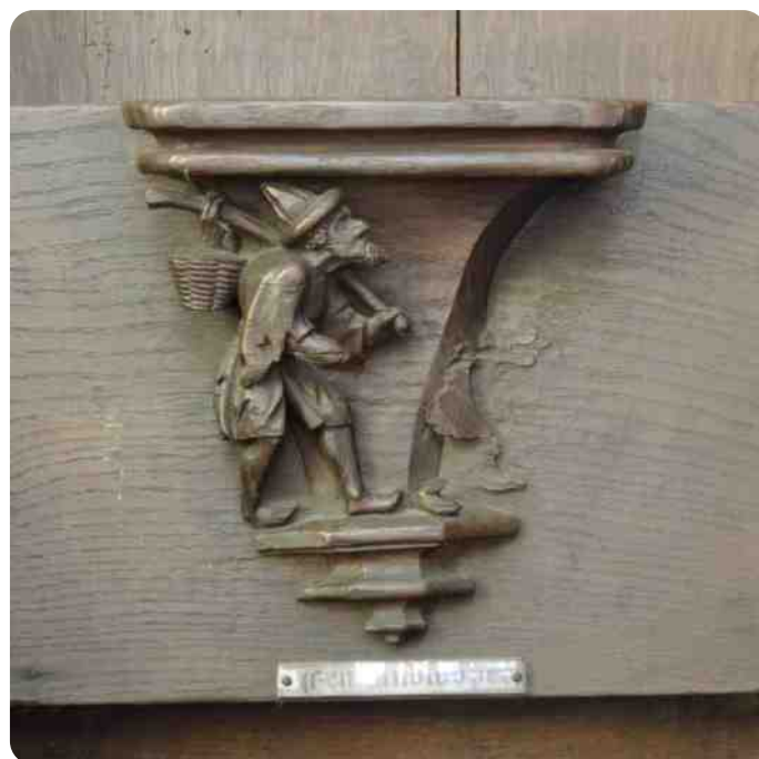
Marskramer met Jodenhoed