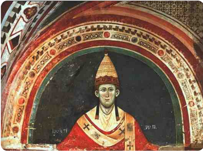
Paus Innocentius III (1160 - 1216)

Deze stigma-maatregel werd genomen door paus Innocentius III (de onschuldige) op het vierde Lateraans concilie in 1215.