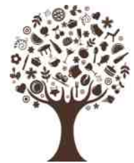
Boom vol gedachten

Tijdens de bijeenkomst stellen we zelf een ritueel samen om deze bijeenkomsten af te sluiten.