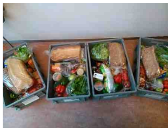
Voedselkratten die klaar staan voor de wekelijkse verdeling.