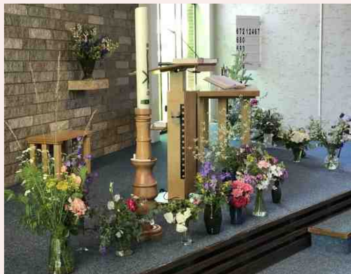
Bloemen in de Pinksterdienst zondag 9 juni; (© Roos Boonstra)

Onderwerp: Biodiversiteit in natuur en landbouw