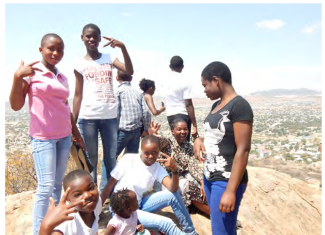
Lion Rock_Girls together