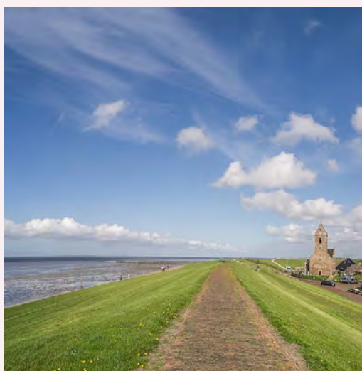
De Mariakerk van Wierum achter de zeedijk