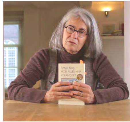
(Antjie Krog 2019)

Tenslotte worden we weggezonden met de woorden: 'Ga heen in vrede en verheerlijk de Broosheid van het Leven. Ga heen en verkondig de hymne van het water, het rentmeesterschap over de Aarde en alles wat daarin, daarop en daaruit duurzaam bestaat. Ga heen, word Verzorgers van de Aarde en tors het Juk van Kostbaarheid.'