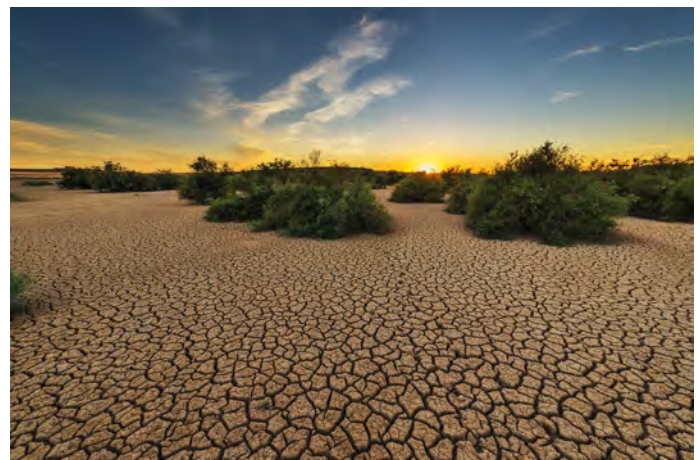
(de verdroogde aarde; afbeelding van Jose Antonio Alba via Pixabay)