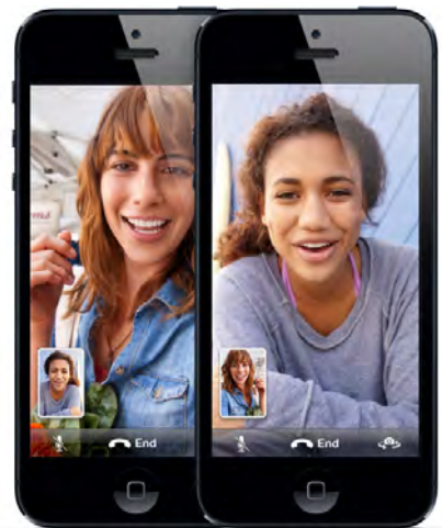
(Facetime of Skype)