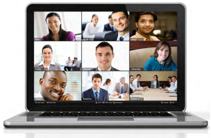
(Samen via Teams of Zoom)