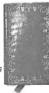
Eén van de Bijbels uit de verzameling van ds. Bierenga

'Bij zijn komst heeft Hij [Christus Jezus] vrede verkondigd aan u, die veraf waart, en vrede aan hen, die dichtbij waren; want door Hem hebben wij beiden in één Geest de toegang tot de Vader. Zo zijt gij dan geen vreemdelingen en bijwoners meer, maar medeburgers der heiligen en huisgenoten Gods, gebouwd op het fundament van de apostelen en profeten, terwijl Christus Jezus zelf de hoeksteen is. In Hem wast elk bouwwerk, goed ineensluitend, op tot een tempel, heilig in de Heer, in wie ook gij mede gebouwd wordt tot een woonstede Gods in de Geest.'