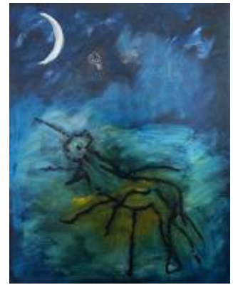
Besef van regelmaat