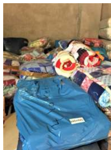
Comforters, in een pakhuis in Jordanië