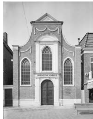
Doopsgezinde kerk Almelo