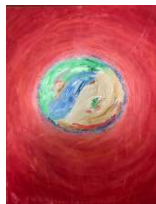
Schepping vergaat zonder verwondering

Deze schilderijen zijn actueler dan ooit!