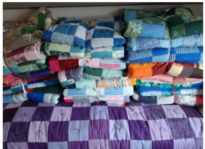
De stapel comforters bij Betty Plas.