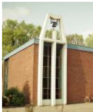
Remonstrantse kerk Hengelo