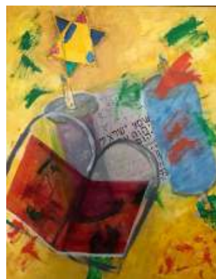
Kennis is goud