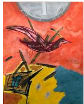
Geld maakt alles mogelijk