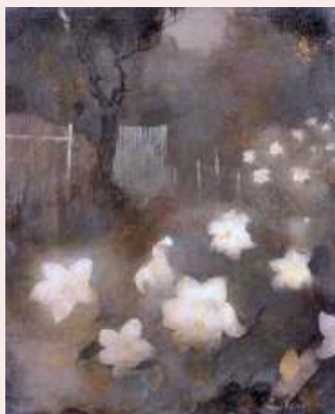
Jan Mankes: Leliën