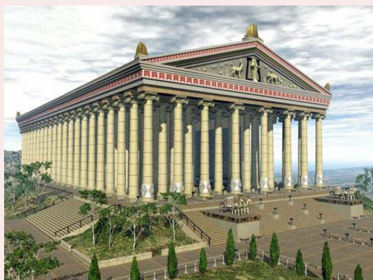
Temple of Artemis reconstruction.

Entree: leden/vrienden: € 5,- , anderen: € 10,-