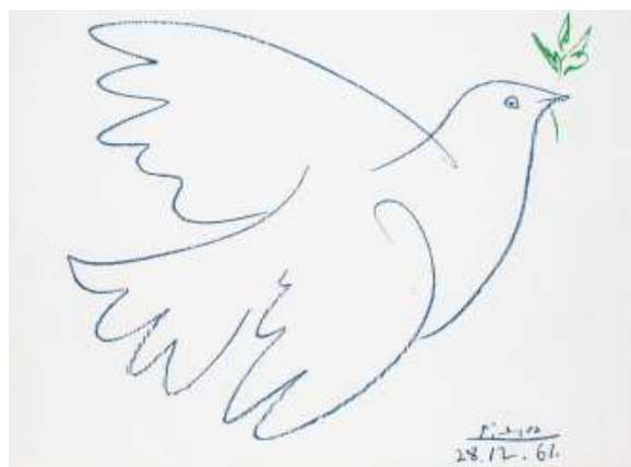
Vredesduif Pablo Picasso