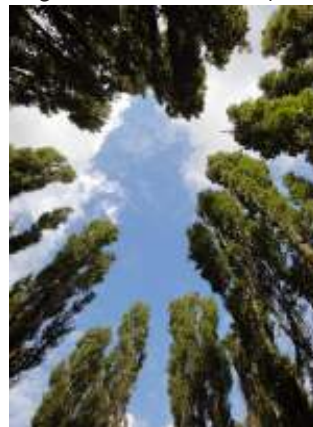
'Groene kathedraal' Marinus Boezem, Flevoland

Augustus 2015. Leo Raph. A. de Jong o.p.