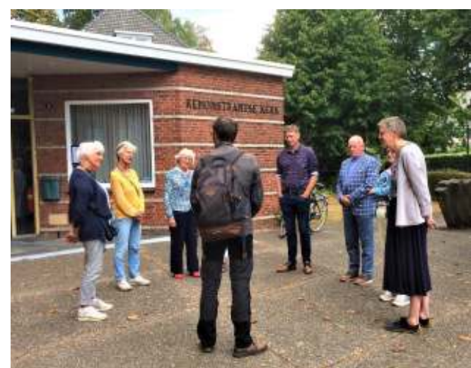
Workshop De natuur