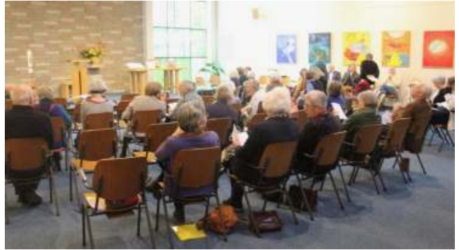
Wachten op wat komen gaat