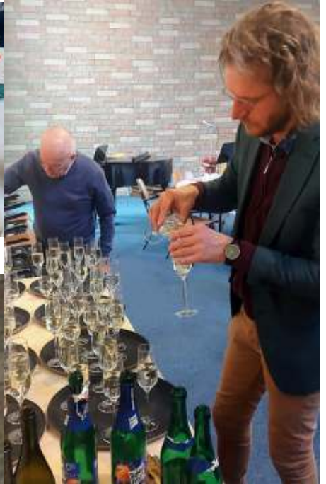
De 'bubbels' om mee te toosten