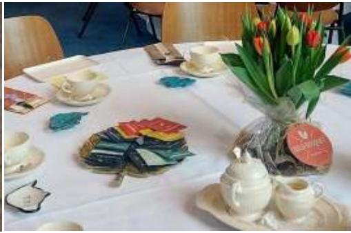
Prachtig gedekte tafels