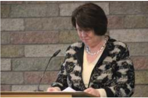
Eerst de preek, dan het feest