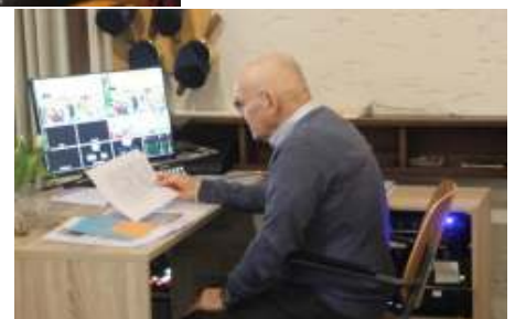
Alles wordt goed voorbereid