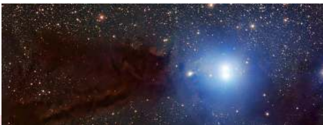
Passant - April 2023