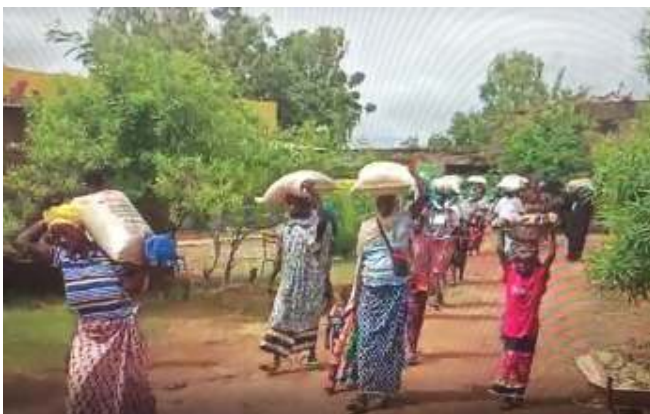
uitdeling voedsel door organisatie Nasongdo in Burkina Faso, nov. 2022