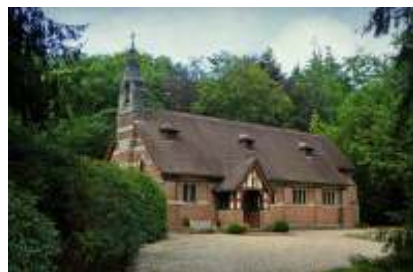
St. Mary's Chapel in Weldam