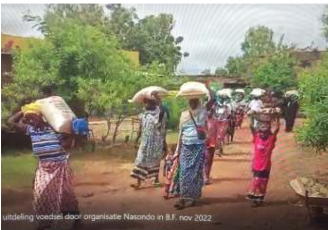
uitdeling voedsel door organisatie Nasongdo in Burkina Faso, nov. 2022