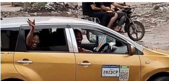
Vertrek Neela naar Kinshasa, Congo