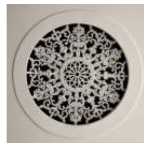
Een van beide gietijzeren plafondroosters, gegoten in Borne