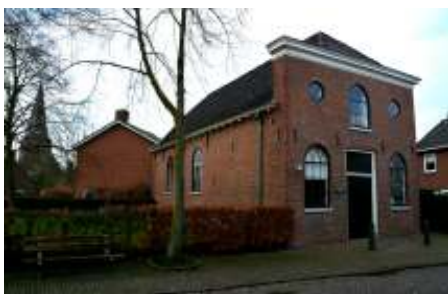
De Vermaning uit 1824 met erachter de 'pastorie' uit 1964