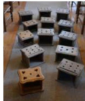
De stoven deden dienst tot de aanleg van cv in 1984