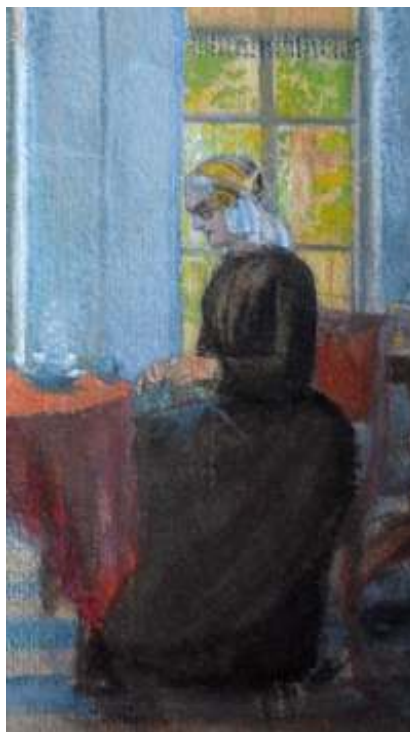
Moeke Gorter-Koopmans in de oude pastorie, detail crayon ca 1877